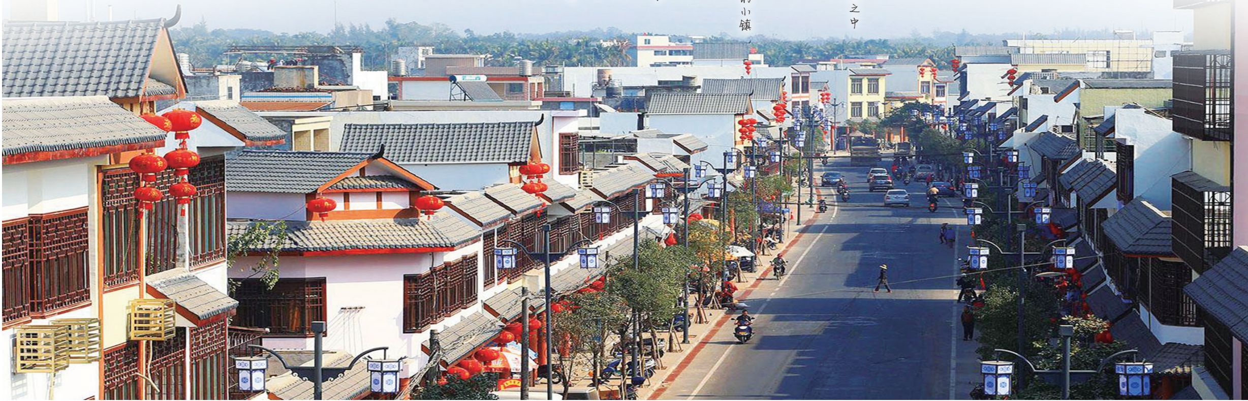
塔洋小镇古色古香。

携一份历史的沧桑 穿梭在 各个陈旧的记忆片段之中 此镇 此风 一览风月漫闲时光 塔洋 一座与历史一般厚重的小镇 仿古风情 明朝建筑风格 诉说 她与这座小镇的故事 聚奎塔 “中”洋：田洋 在这里 描绘最为惊艳的一笔 端山耸翠 赵水凝香 奎塔凌霄等 尽显塔洋魅力 在这古邑风情小镇 流连忘返 看时光流逝 就在这般岁月静好 与城终老