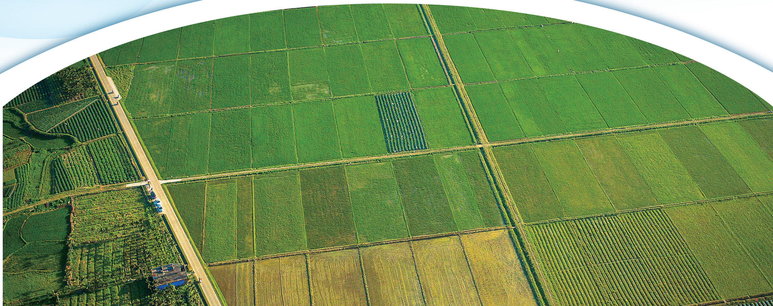
海南发展生态农业具备大时地利。