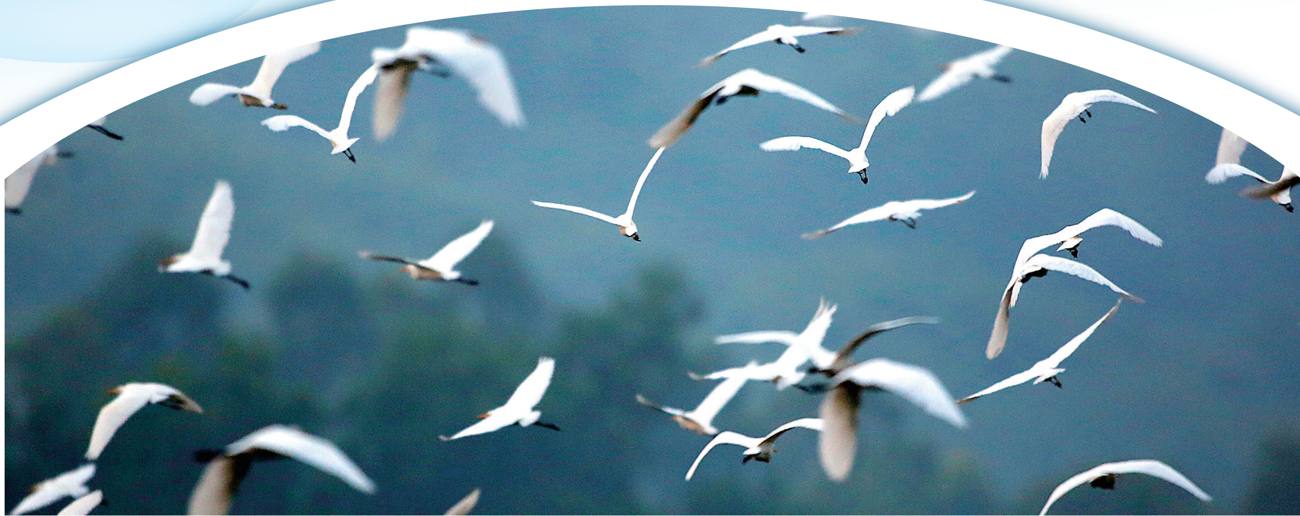
海南生态环境越来越好，吸引越来越多的鸟类栖息。