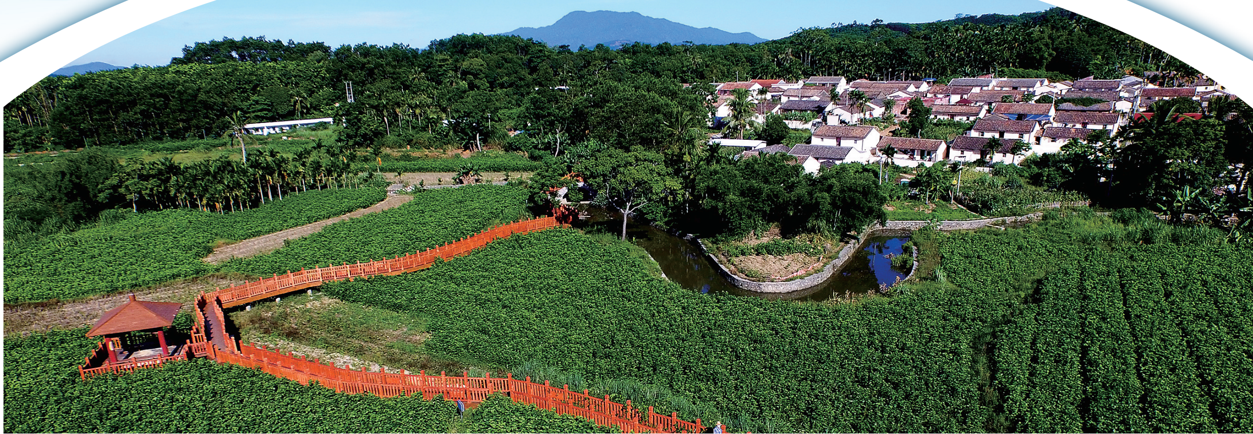
琼中黎族苗族自治县湾岭镇岭脚村,桑叶长势旺。