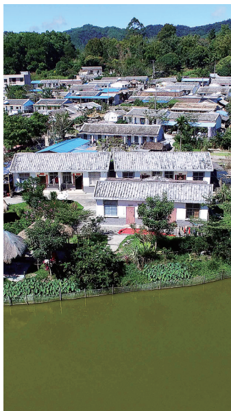
琼中什寒村。

琼中近年紧紧围绕“打绿色牌，走特色路”总体发展思路和“一心一园一带八区”总体发展布局，坚守生态环境保护底线，走绿色发展之路，一座别致的生态县城，正在魅力生长。