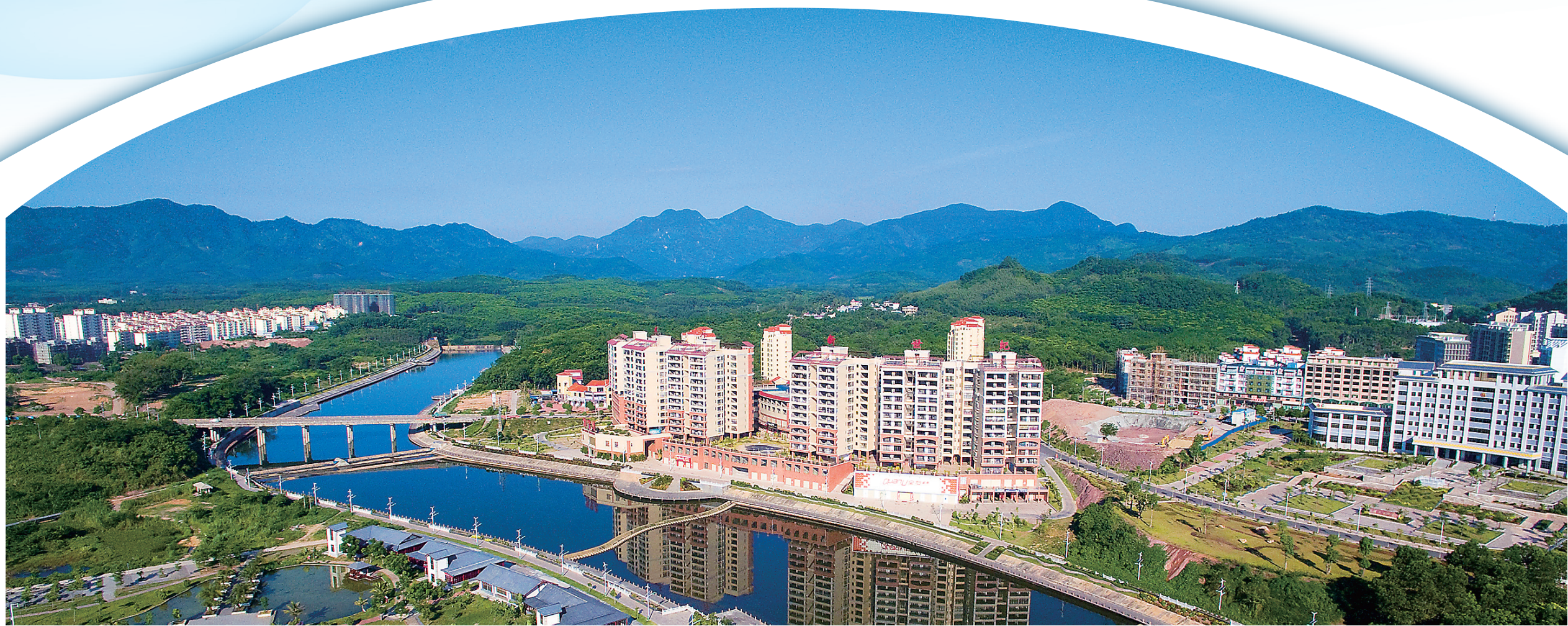
白沙黎族自治县南叉河两岸清新亮丽。