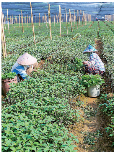
白沙农场茶苗种植基地。

在白沙苗族村寨，人们载歌载舞迎接游客，并以“三杯酒”“三色饭”盛情款待。“三色饭”，呈现红、黑、黄三种颜色。