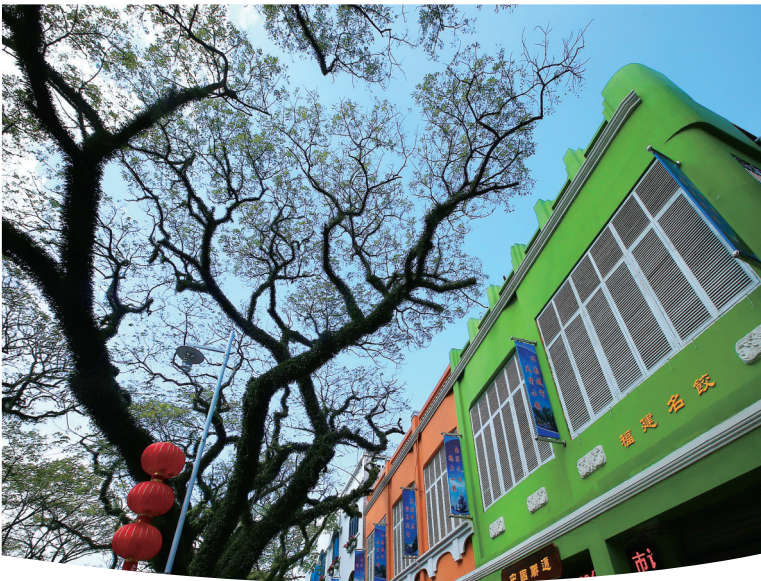
琼海中原风情小镇上迷人的绿荫街道。