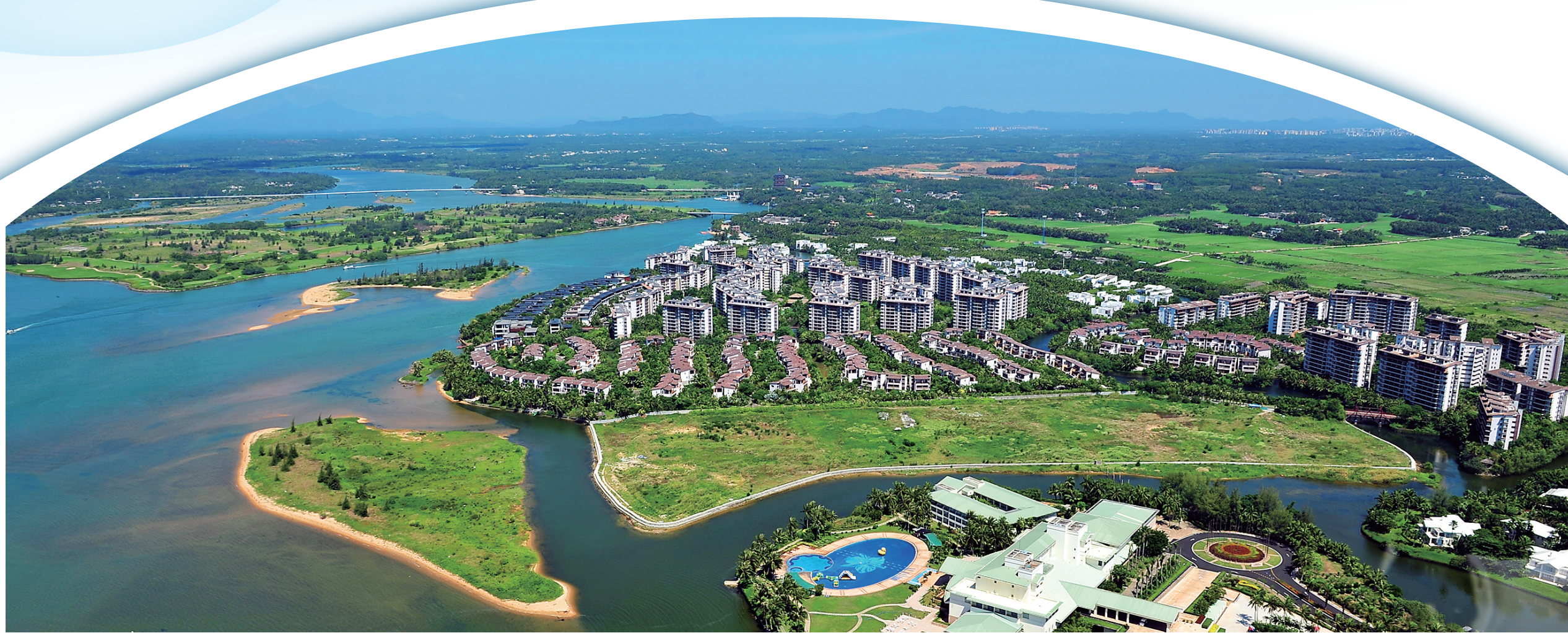
如今的琼海，城市生活的便利同乡村美好环境融合在了一起。图为鸟瞰博鳌美景。