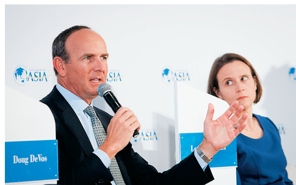
在博鳌亚洲论坛2016年年会“未来的消费”分论坛上，全球知名公司领导人就年轻一代消费行为交流看法。这是美国安利公司总裁戴·狄维士(Doug DeVos)在发言。