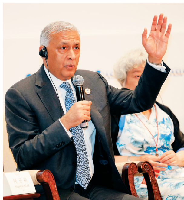
巴基斯坦前总理阿齐兹在博鳌亚洲论坛2016年年会“一带一路与亚洲金融合作”分论坛上发言。