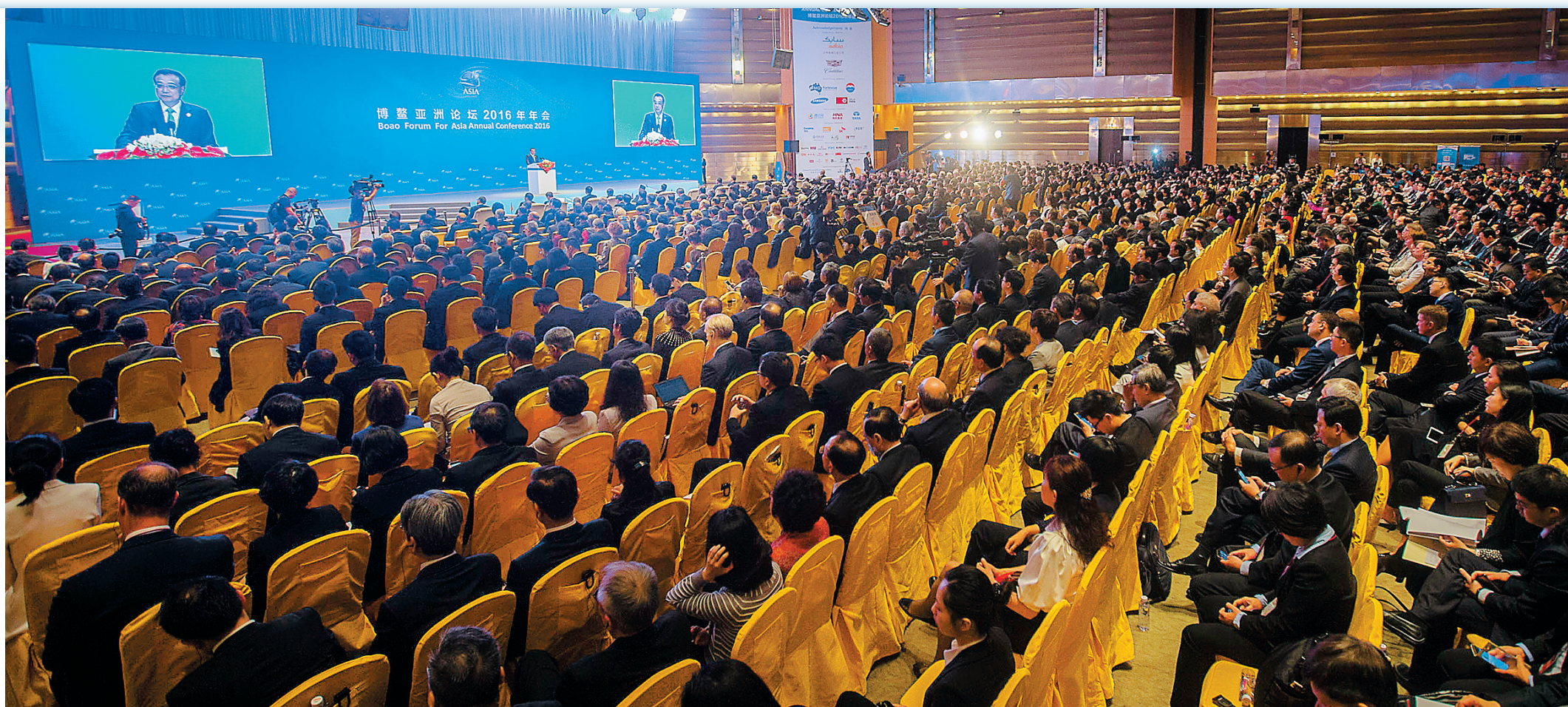
3月24日，博鳌亚洲论坛2016年年会开幕，国务院总理李克强出席开幕式并发表演讲。