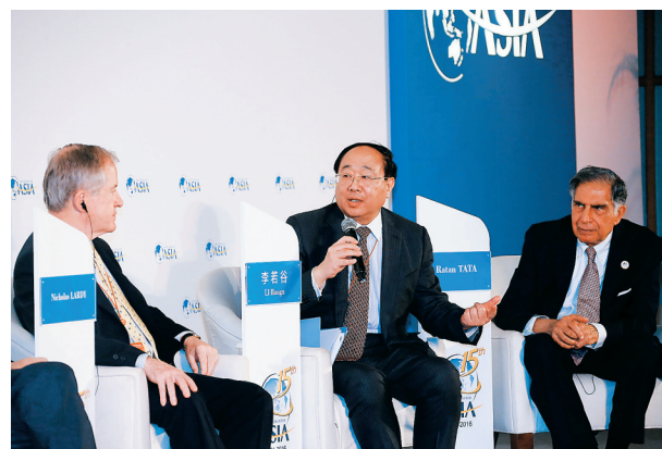
在博鳌亚洲论坛2016年年会“亚洲资本的全球化”分论坛上，嘉宾在对话交流。