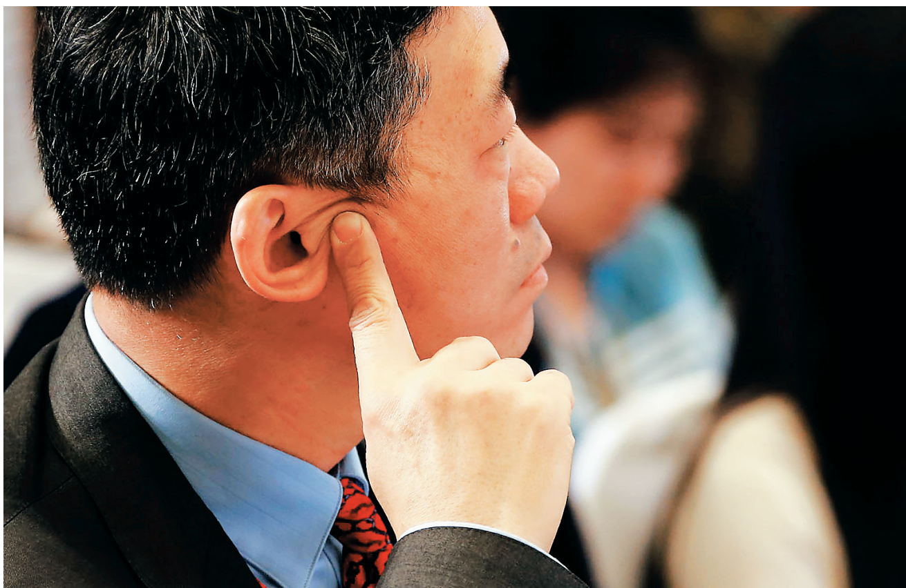
清华大学苏世民书院院长、清华大学中国与世界经济研究中心主任李稻葵倾听其他嘉宾发言。

博鳌春和景明，博鳌风云激荡。 浸润在春雨中的博鳌愈发闪亮，与会嘉宾在这里对话和讨论、激辩与倾听，汇聚全球政界、商界、学界的智慧之光在这里碰撞出火花，为亚洲调整经济结构，创新科技和产业，拓展深化区域合作，促进基础设施互联互通提供着新思维、新路径、新举措。 在这里，关于亚洲未来的共识正在凝聚，关于亚洲发展的新愿景正在描绘。