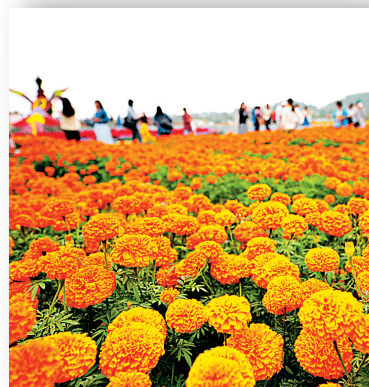
凤凰花海