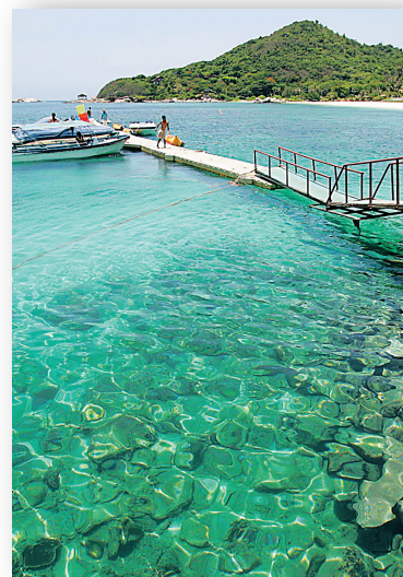
蜈支洲岛