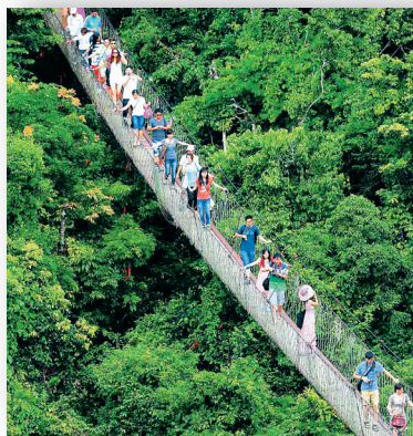
热带天堂森林公园