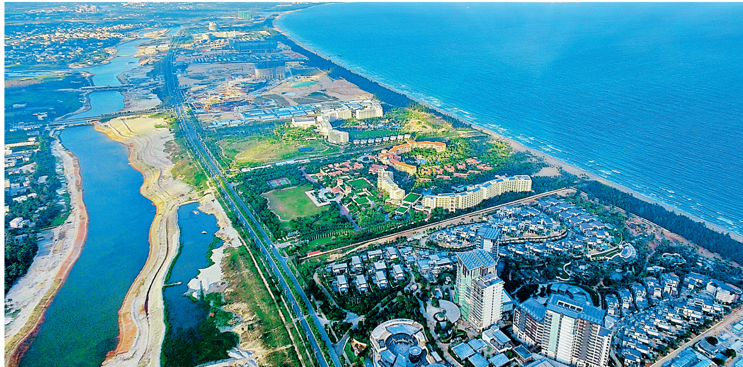
三亚海棠湾。