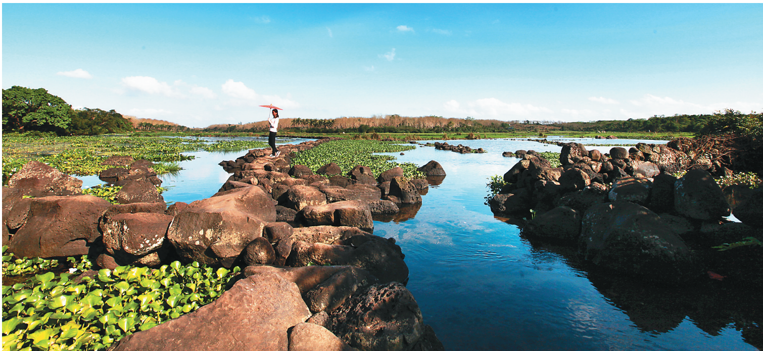
冷泉风光。