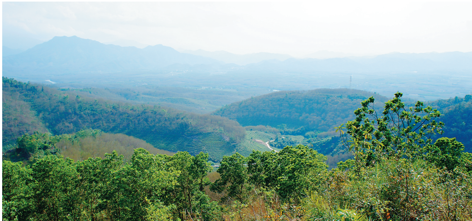
白沙陨石坑地质公园自然美景。