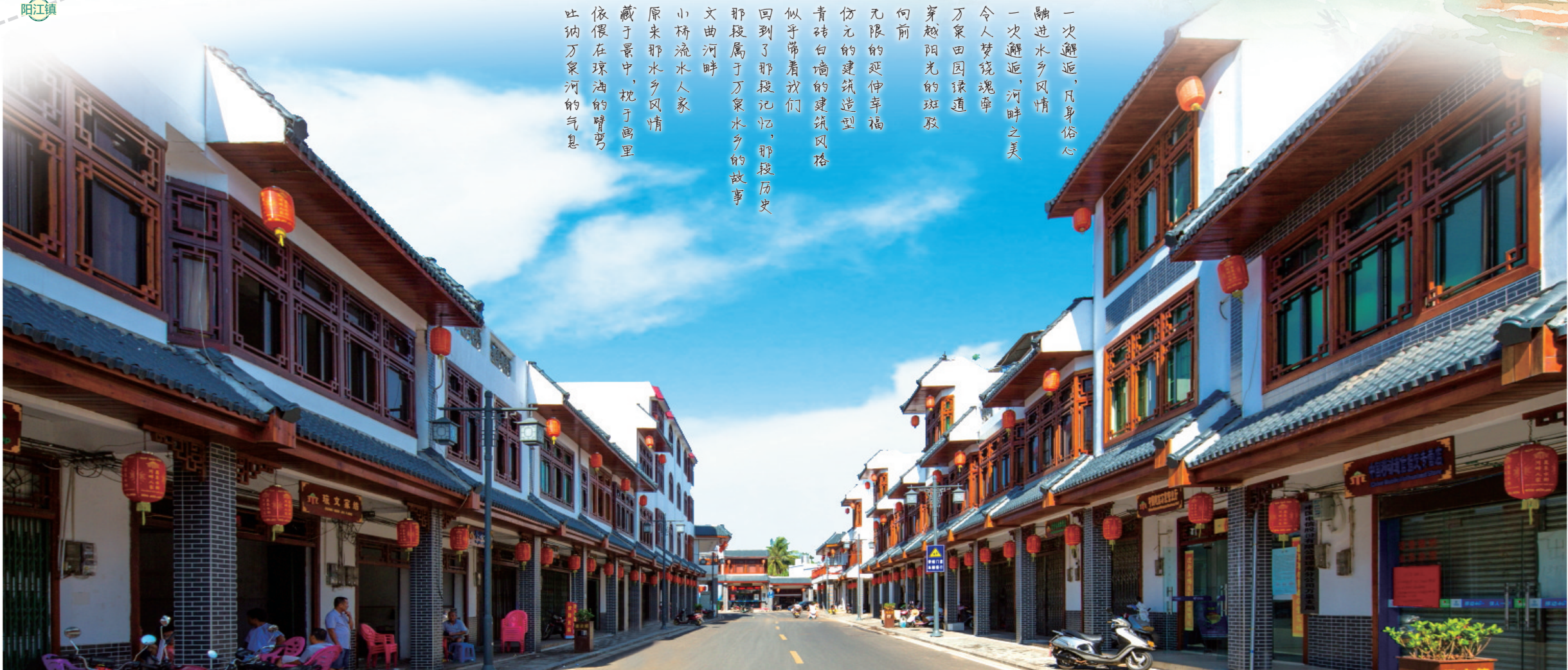
美丽的万泉镇街景。

一次邂逅，凡身俗心 踏进水乡风情 一次邂逅，河畔之美 令人梦绕魂牵 万泉田园绿道 穿越阳光的斑驳 向前 无限的延伸幸福 仿元的建筑造型 青砖白墙的建筑风格 似乎带着我们 回到了那段记忆，那段历史 那段属于万泉水乡的故事 文曲河畔 小桥流水人家 原来那水乡风情 藏于景中，犹于画里 依偎在琼海的臂弯 吐纳万泉河的气息