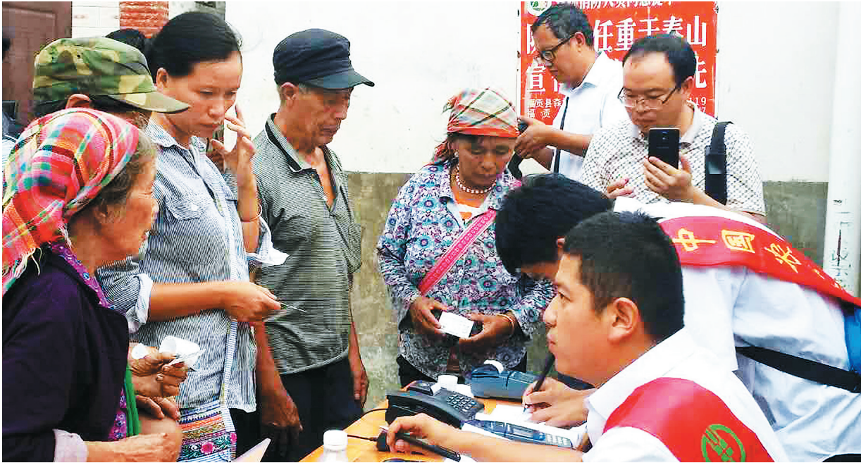
图为农行云南福贡支行员工在为村民发放金融社保卡。