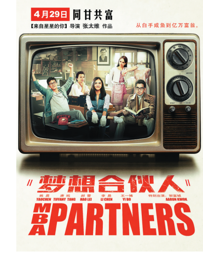
《梦想合伙人》最新海报

蕾并非一开始就是闺蜜合伙人,三人经历了一番波折才相互接纳。身份背景的大相径庭,以及经历、观念的差别,令她们在商学院一相遇便火力十足。但不论各自的出身背景有多大差别,回归生活中后,她们也只能是普通女性,各自都要面对各自的困境。在互撕与创业之间,三个女性最终志同道合,成为了令人动容的“女版合伙人”,开创了一番全新的互联网创业新生活。