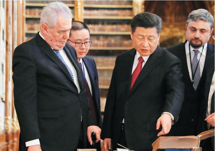
3月30日,国家主席习近平在捷克总统泽曼陪同下在布拉格参观斯特拉霍夫图书馆。

交流,为双边关系进一步发展打下良好基础。中方愿同捷方保持高层接触,增进战略互信,深化各领域互利合作,谱写中捷关系新篇章。 泽曼表示,热烈祝贺习近平主席对捷克的历史性访问取得圆满成功。捷克高度重视捷中关系,愿同中方共同推动务实合作,造福两国和两国人民。 斯特拉霍夫图书馆是捷克最古老的图书馆,已有850多年历史,藏有20余万册珍贵书籍。