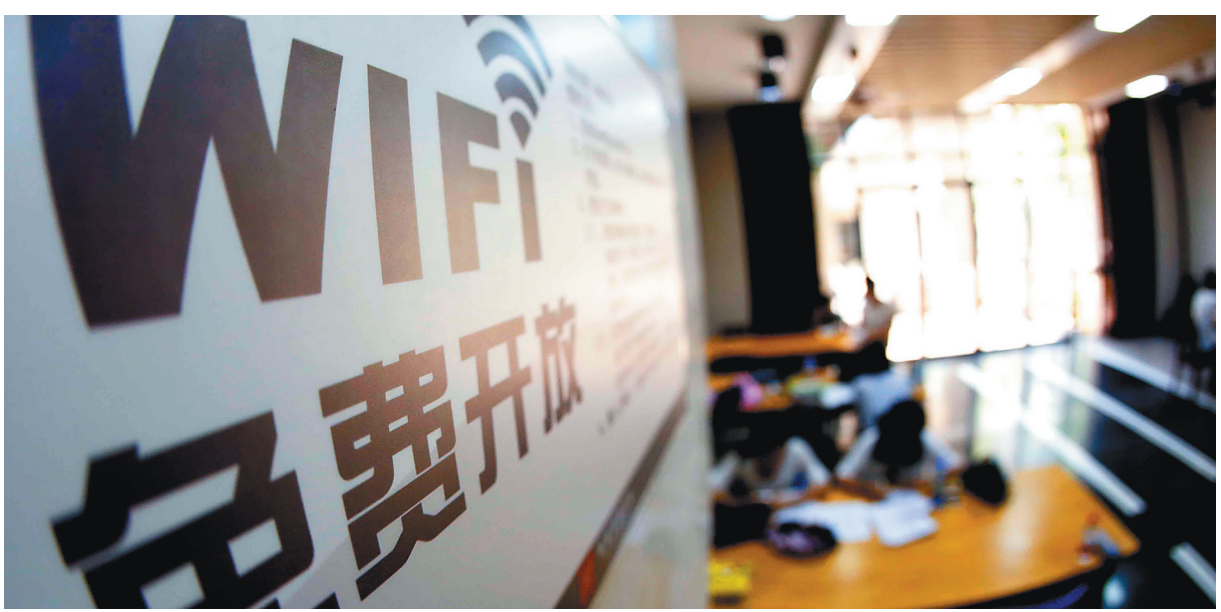
海南省图书馆，WiFi免费向读者开放。