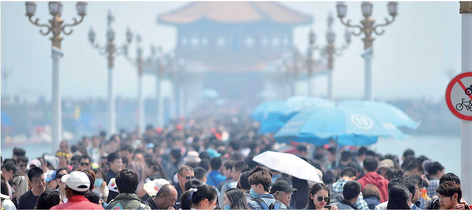
五一小长假青岛栈桥游人如织。

泰山观“人山”、西湖看“人海”、北京八达岭长城密密麻麻全是人……五一小长假，记者在北京、安徽、浙江、山东等地旅游景点采访发现，一些景区节假日多次超出游客最大承载量，一些景区接待游客量虽未超限，但游客反映拥挤不堪。旅游法规定“景区接待旅游者不得超过景区主管部门核定的最大承载量”，为何未能成为保障游客体验的“红线”？