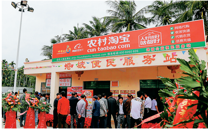
陵水黎族自治县光坡镇坡坡村淘宝服务站,提供网购商品的代买和农产品的代卖服务。

这说明,我省农村地区对互联网的认识尚处于初级阶段。各实践团队也通过对村民关于互联网的潜在需求调查走访发现,只有9%的村民表示急需通过互联网等手段来销售产品、采购农资,没有这方面需求的村民竟高达41%。