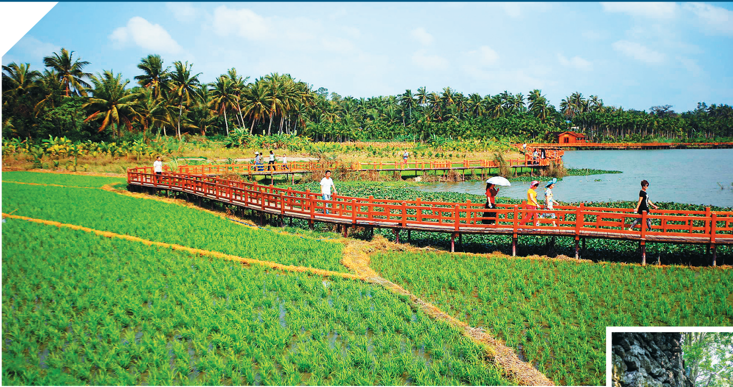
到琼海「七星伴月」景区品田园味道。