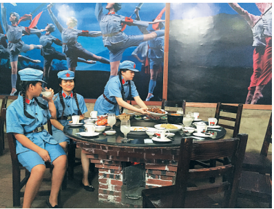
琼海阳江“公社食堂”。