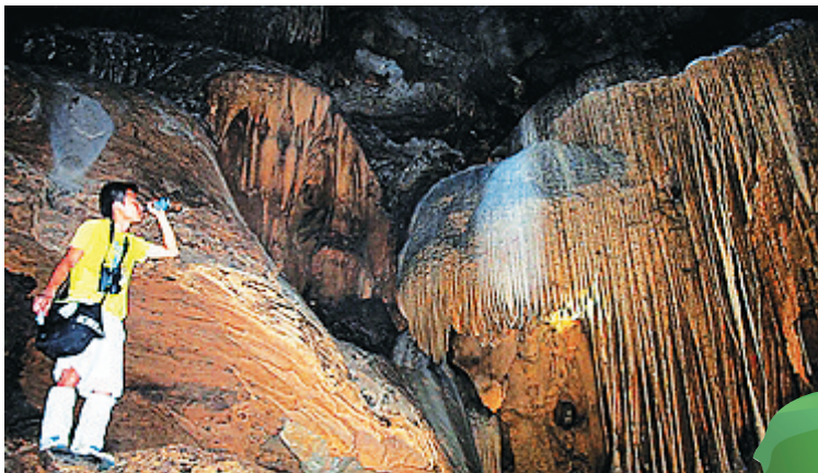
俄贤岭蝙蝠洞洞中有洞,景观各异。

牟满志表示,景区建设将立足生态,以生态保护为前提,不开山、不砍树、不毁石,并着手恢复当地优秀传统文化,同时保护好自然生态和文化生态。此外,景区建设还将和旅游扶贫紧密结合,打造成东方旅游扶贫示范区,通过企业带动,使周边黎族群众参与旅游产业,从而实现脱贫致富。