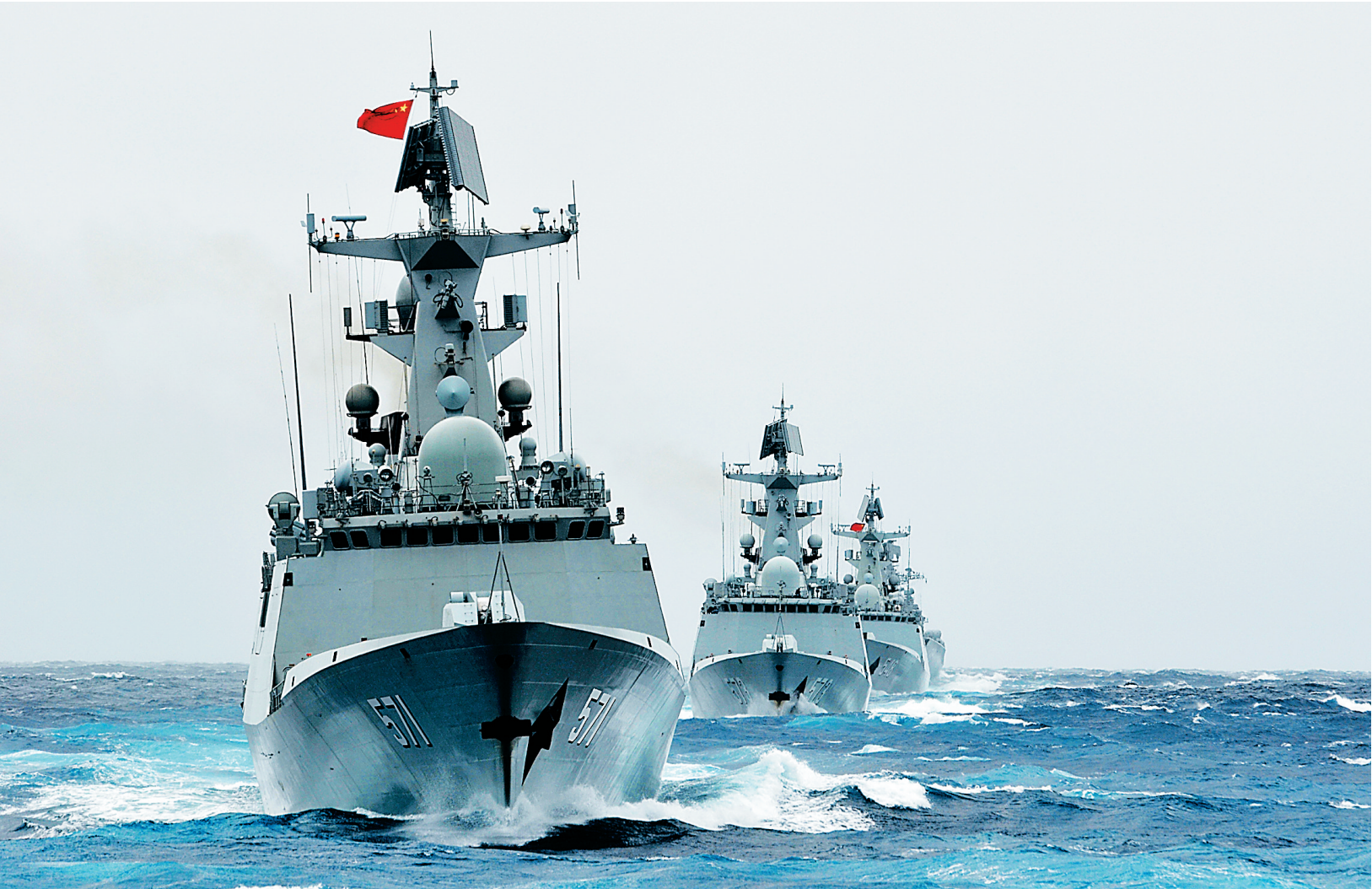
乘风破浪的海军南海舰队某驱逐舰支队。

洪磊说,由于历史原因,日本发展走向一直受到亚洲邻国高度关注。希望日方切实吸取历史教训,顺应时代潮流,倾听爱好和平的民意呼声,坚持走和平发展道路,为本地区的和平稳定发挥建设性作用。