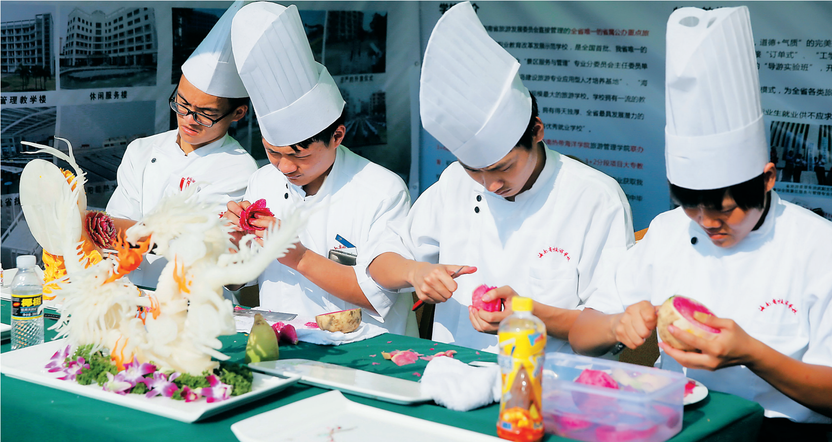
5月6日,在省歌舞剧院广场,参加省“职业教育活动周”活动的学生展示菜蔬雕花技艺。