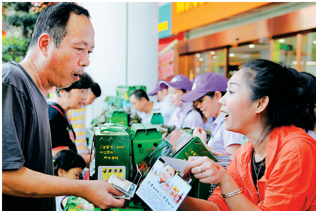
儋州粽子宣传推广季启动现场，一位儋州粽子企业员工在向海口市市民推销粽子。

体店销售、进社区设营销点、在景区码头设营销点、进机关进校园食堂、进酒店、开设形象店。 在众多有效模式助推下，儋州粽子产业将迎来“井喷式”发展新态势。去年底以来，该市就明确了冲刺目标，即2016年端午节至2017年端午节期间，将生产销售儋州粽子3000万个。届时，儋州粽子将再度跃上新的平台。 （正宗 张琳）