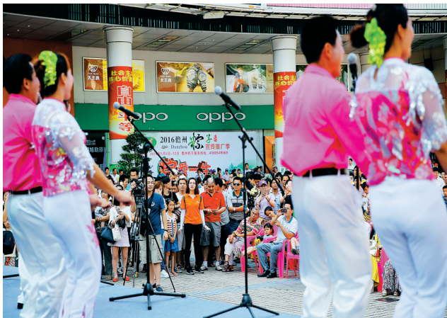
儋州粽子宣传推广季启动现场，精彩的表演吸引了人们的眼光。