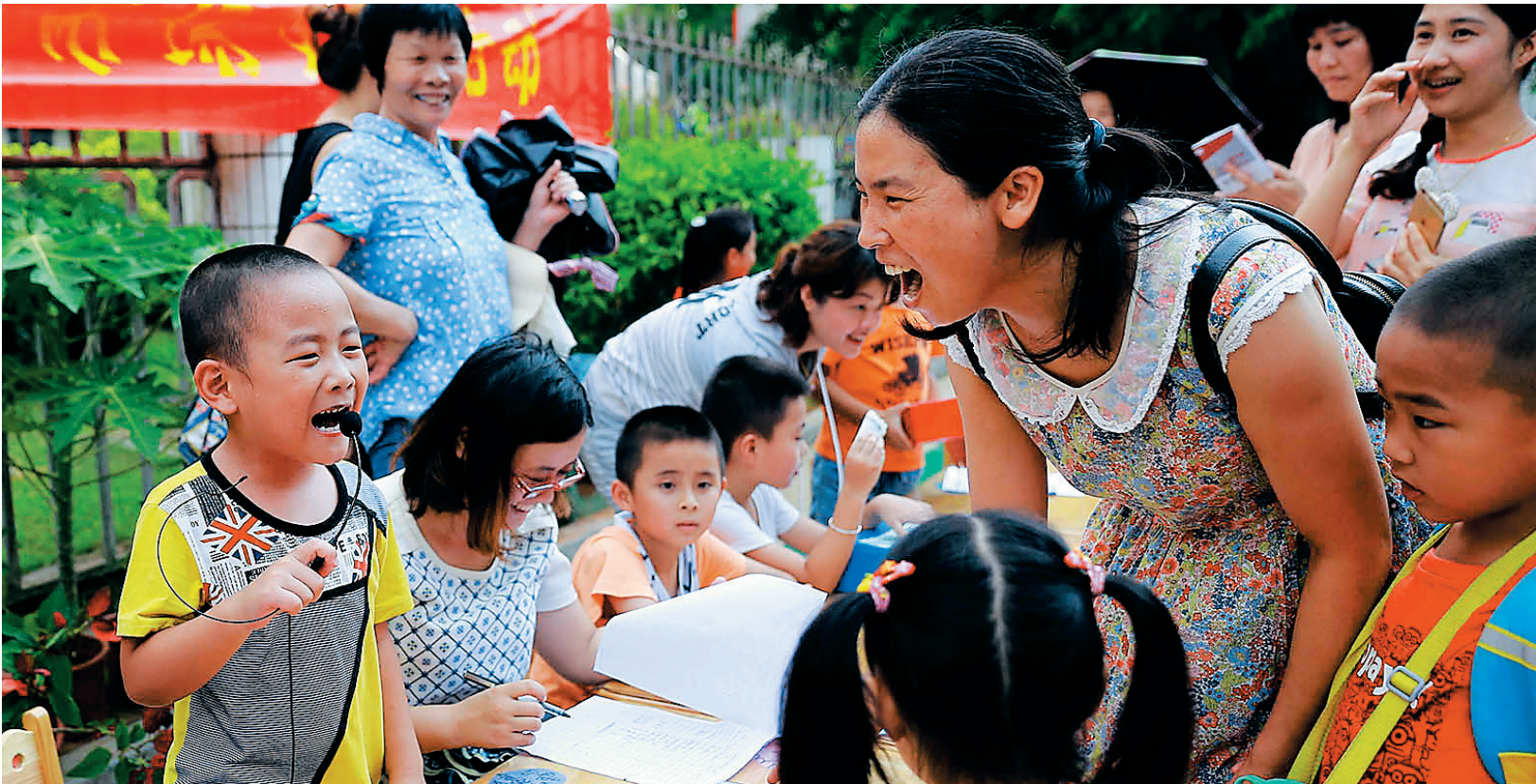
海口：幼儿园义卖图书献爱心

本报海口5月8日讯（记者郭萃 通讯员吴思标）近日，海口市琼山区南北食药监所发现一批超标使用农药“乐果”的问题广东潮柑，并封存该批快检阳性柑橘共计9912斤，目前琼山区食品药品稽查大队已立案调查。