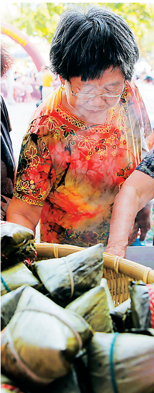
5月8日，海口市民在海口明珠广场“粽爱一生”儋州粽子宣传推广季启动现场品尝、购买粽子。

很大的儋州粽子，在浸润“文气”、“仙气”同时，受到省内外消费者的青睐。 “儋州粽子吃起来有一种文化味。”一位名叫“吾爱儋粽”的网友在空间里的留言很有文艺范儿，但的确道出了儋州粽子厚重的人文底蕴。 “儋州粽子块头大、分量足、口感好，去年端午节时我买了50个，今年至少要买200个，不仅自己吃，还要让亲友们分享。”来自湖北的游客李历雄说。 广东一家私营企业老总汪先生透露，近三年来，他每年都要购买300个儋州粽子，作为福利发给员工；今年，由于企业效益好，他打算在端午节前购买500个儋州粽子，与员工一起分享。