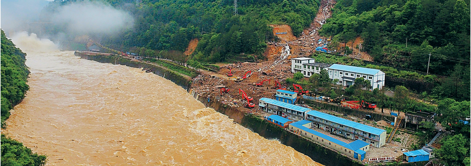
泰宁泥石流灾害现场 已发现34具遇难者遗体

据新华社北京5月9日电(记者王立彬)国土资源部地质灾害应急管理工作办公室9日晚间通报称，国务院工作组5月9日对福建泰宁“5·8”地质灾害现场进行实地踏勘，初步认定此次地质灾害为泥石流。 针对现阶段抢险救灾进展情况和下一步工作，国务院工作组提出全力以赴开展搜救，目前仍然处于黄金救援期，只要有一线希望，就要付出百倍努力，采取多种措施，想方设法，在保证搜救人员安全的前提下，加快搜救进度；切实防范次生灾害，密切关注前往现场和沿线道路周边山体，加强隐患排查和监测预警，救援车辆保持车距与控制车速，严防二次灾害造成人员伤亡；妥善做好伤员救治和伤亡人员家属安抚，把各种方案和预案制定得更细一些，考虑得更周全一些，稳妥处理善后工作；由福建省人民政府负责，成立专家工作组，科学认真、实事求是地开展泥石流成因调查，并就“5·8”泥石流灾害抢险救灾有关情况向国务院作出专门报告；举一反三，吸取教训，迅速在全省范围内开展水电工程、矿山企业等地质灾害隐患的巡查排查，避免类似灾害的发生；正确引导社会舆论，及时公开调查进展，主动回应社会关切。 据了解，灾害现场的人员搜救、次生灾害隐患排查、泥石流成因调查、失踪人员家属安抚等工作，正在有序有效地展开。