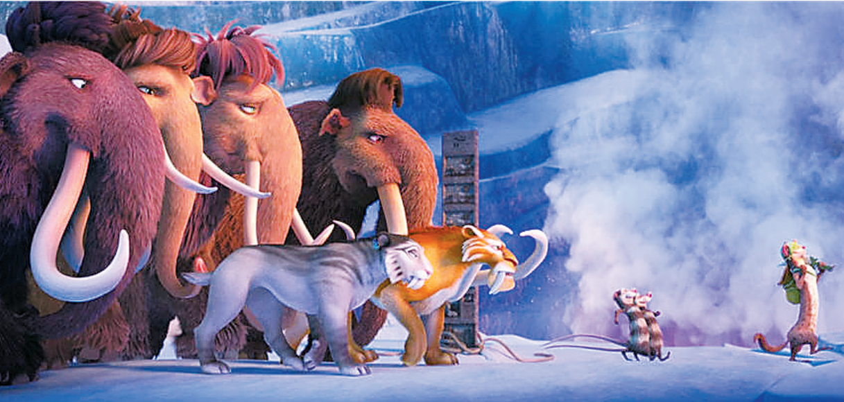
《冰川时代：星际碰撞》里的动物明星。

临的冒险将会全面升级，也会比前几部更为爆笑。除了那个让人又爱又恨的巴克会回归之外，本部片子还有一个新角色出现，一只美丽的美洲驼香格里拉出现。据悉，这一部松鼠带来的这个灾难，会引发冰川地质年代的终结，也就是说“冰川时代”将会迎来终结，之后会开启一个新的时代，所以这一部对于喜欢一系列的观众来说不容错过。该片将于暑期档7月22日在北美上映，中国内地有望引进。（小文）