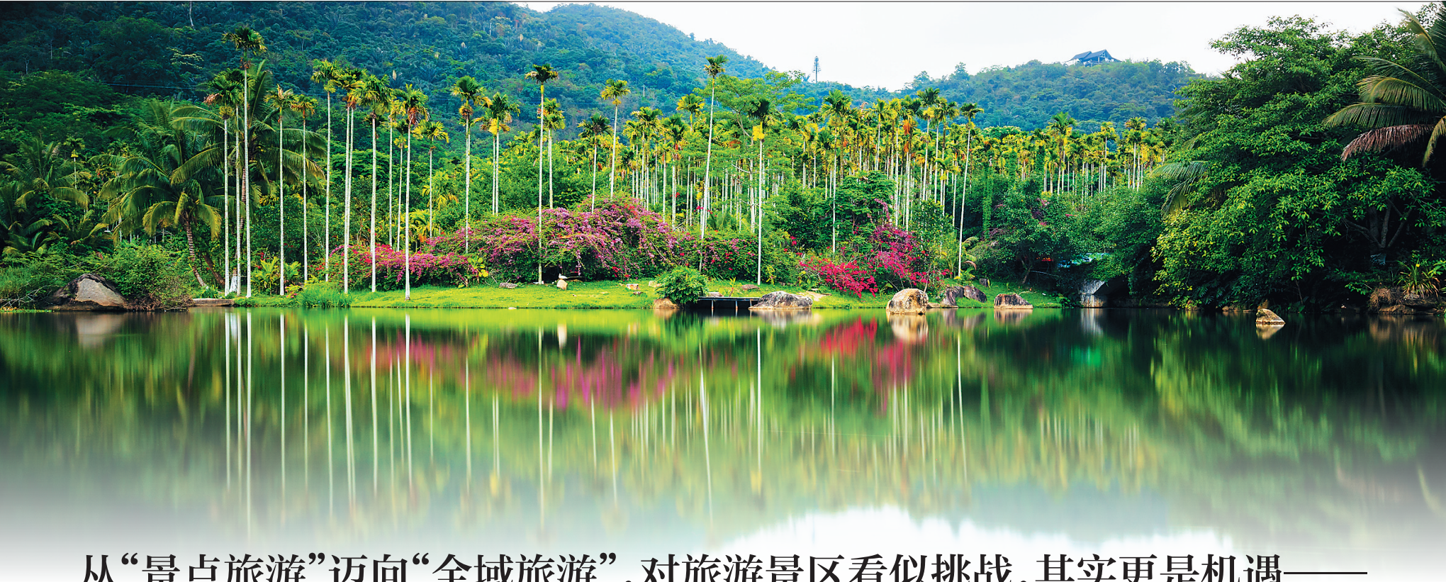
呀诺达雨林文化区。(资料图)