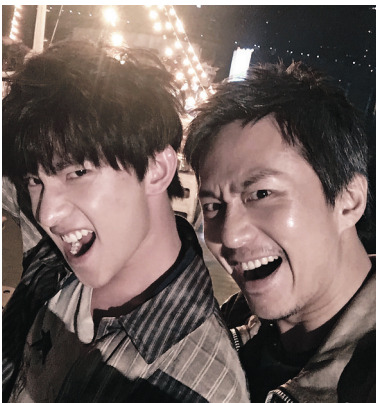
杨洋（左）、邓超片场照

记者了解到，邓超将在这部新片中饰演陈末，张天爱饰演幺鸡，而原著中另一个很有趣的人物茅十八显然将由杨洋饰演。邓超、张天爱影迷都比较熟悉，而杨洋作为人气小鲜肉，除在网剧、综艺节目和电视剧方面表现出色外，电影方面他只有《左耳》饰演的许弋为观众熟知。如今加盟《从你的全世界路过》，相信会带给影迷们惊喜。