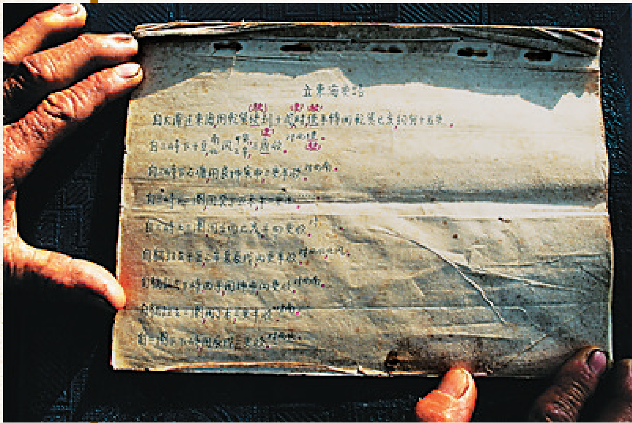
琼海市潭门镇的老船长收藏的《更路簿》。

发展，渔民们不再使用《更路簿》来指导自己到南海捕捞了，古老的《更路簿》逐渐进入历史，渔民们也愈加陌生；而且，传承面临后继无人，了解《更路簿》的传承人都年事已高并一位位离去。时间非常紧迫，已经到了需要抢救性保护的的地步。我们要设立一个国家专项课题，进行抢救性发掘、研究和保护，彻底把《更路簿》的事攻下来，再不抢救就来不及了！ (作者系海南大学法学院特聘院长，原国家海洋局海洋发展战略研究所所长，国际海洋法法庭法官)