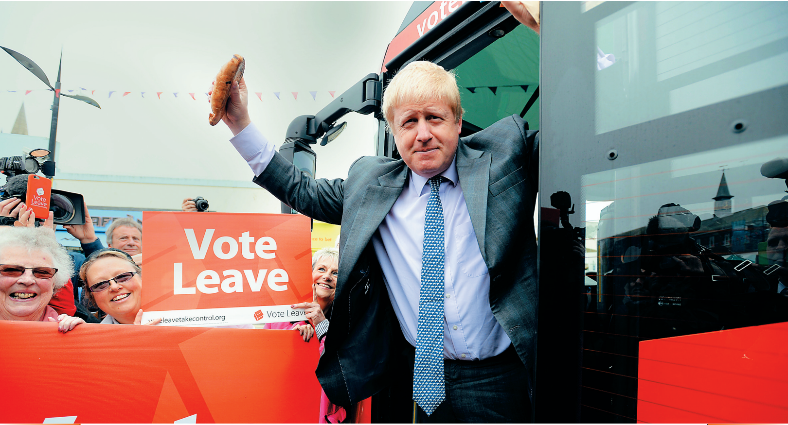
近日，在英国西南部城市特鲁罗，前伦敦市长鲍里斯·约翰逊参加支持英国离开欧盟的拉票巴士的启动仪式。

约翰逊是“脱欧派”中最引人注目的人物之一。英国《星期日电讯报》15日援引他的话报道，欧洲最近2000年的历史表明，总有人试图像罗马帝国一样，把整个欧洲合为一体。 “拿破仑、希特勒等人都试图这样做，但总以失败告终。欧盟也想以不同的方式实现同样目的，”约翰逊说，“然而，这里存在一个永恒的问题，即欧洲统一不得人心。” 约翰逊还说，没有哪一个单一政府能赢得所有人的尊重和认可。离开欧盟后，英国能获得更好发展。 约翰逊为卡梅伦所领导的保守派成员，立场主张却完全与之相悖。卡梅伦力挺英国留在欧盟，为此四处游说。今年4月，美国总统奥巴马访问英国，支持卡梅伦的留欧立场。约翰逊驳斥称，他不想听美国人指手画脚。 另一位主张脱欧的独立党领导人奈杰尔·法拉奇更是直截了当：“奥巴马总统不该管闲事。”他将奥巴马称为“史上最反英的美国总统”，认为奥巴马是在干涉英国内政。