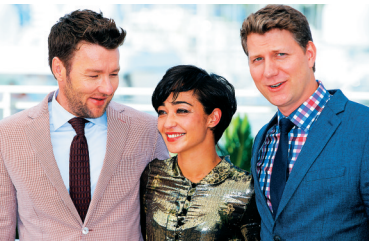
美国片《爱恋》导演杰夫·尼科尔斯(右)、演员乔尔·埃哲顿(左)和露丝·内加布合影

数据显示,中国电影票房正以每年30%的速度增长,但一些好口碑的艺术电影,虽然获得业内认可,却也有批评声音认为表达手法陈旧,缺乏创新。专家指出,在避免商业片“快餐文化”侵蚀的同时,电影的制作还应跟上时代节奏,作出相应调整,创新表现手法。