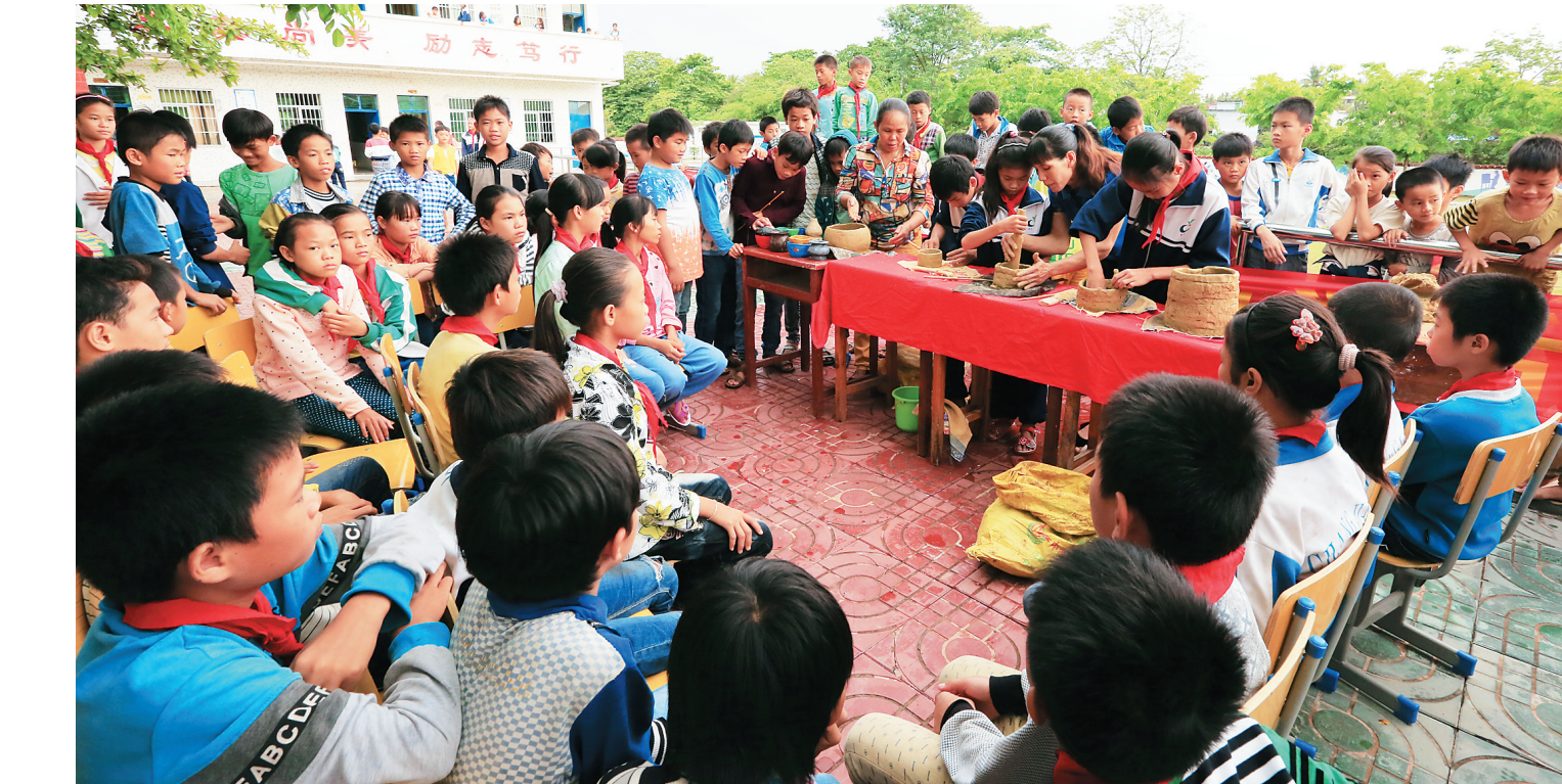
昌江水头小学开展黎陶技艺培训。