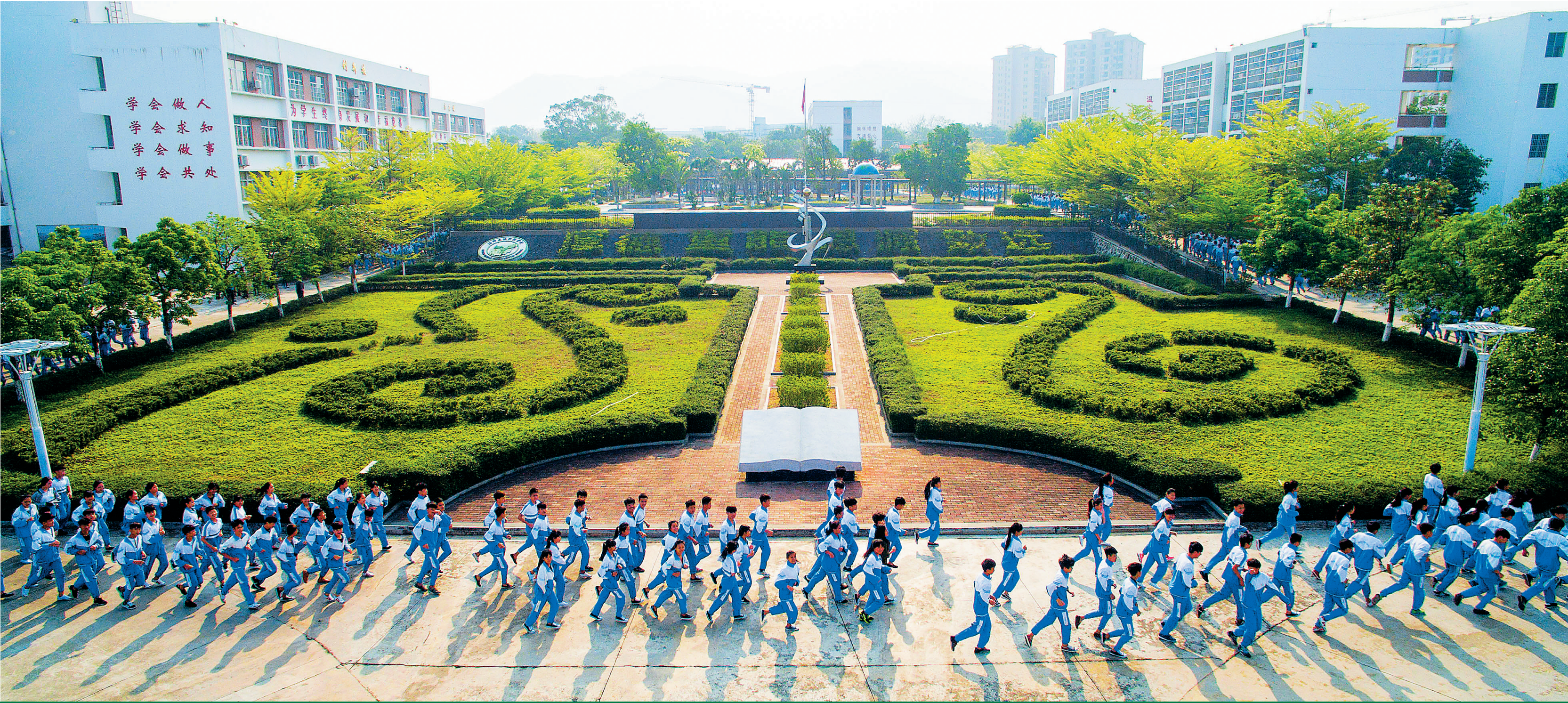
昌江思源实验学校优美的校园环境。

“人才是推动经济社会发展的战略性资源,教育的基础性、先导性、全局性地位和作用越来越突显。”昌江县委书记林东说,昌江以推进义务教育发展基本均衡为契机,树立教育优先意识,站在经济社会发展的战略高度,不断加大投入,加速推进学前教育、义务教育、高中教育和职业教育全面发展,为全面决胜小康社会、加快昌江经济社会发展奠定人才基础。