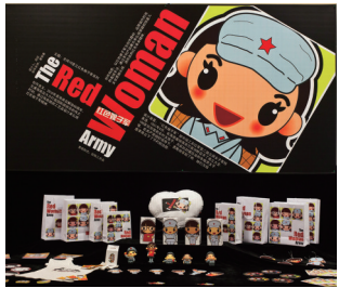
红色娘子军红色旅游纪念品创意包装。