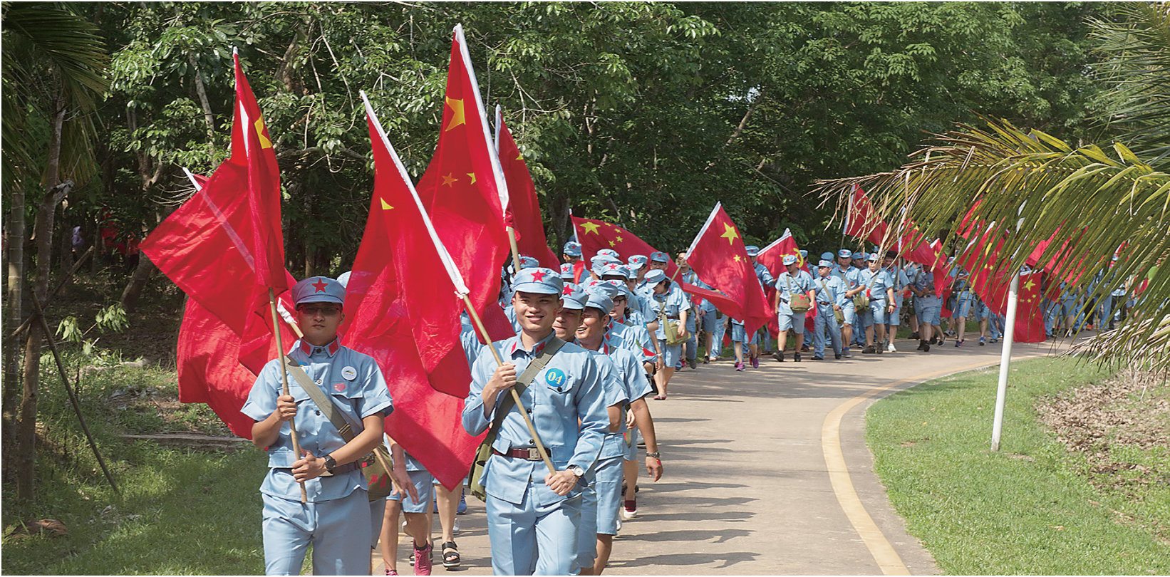
沿着娘子军的足迹重走红色之路。