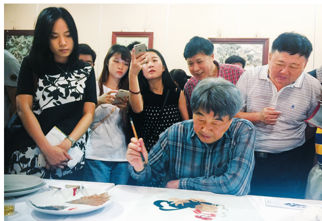
五月二十日上午,陶瓷名家在省博物馆展厅进行现场瓷板画创作。

据悉,此次展览中有不少展品出自国家级工艺美术大师之手,观展群众可现场观看大师进行画瓷表演。