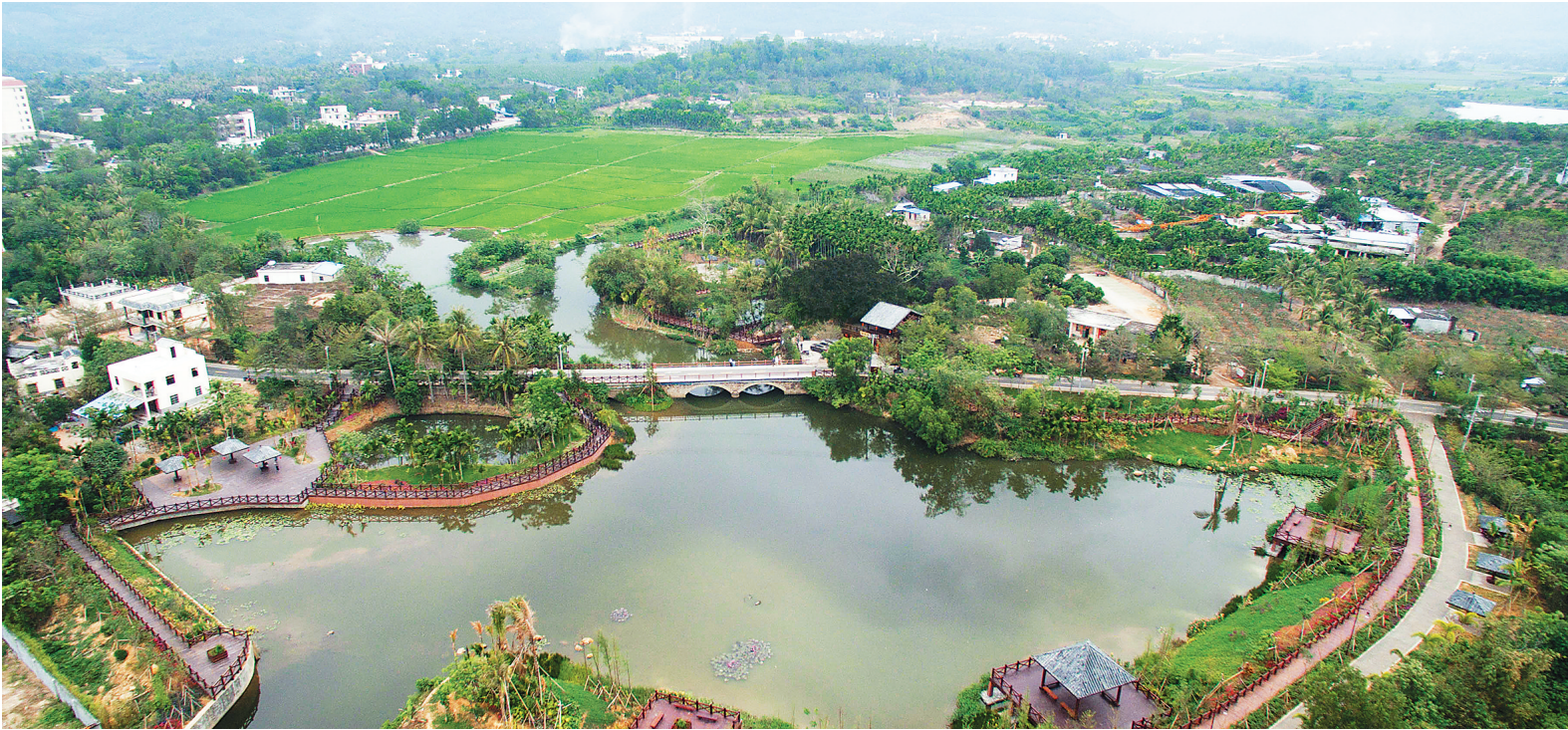
青山绿水环绕,一派田园风光的三亚中廖村。

我省探索建立生态环境司法保护新模式,恢复性司法一年“重生”林木10万株。(见昨日A01版) 犯罪分子被判入狱了,但受损的生态环境得不到修复,荒山依旧,这种情况以前很常见。而惩罚犯罪分子的本意,是保护资源环境。如仅是一判了之,这种本意并没有得到最充分的体现。因此,改变“重打击、轻修复”,通过开展恢复性司法,在判处刑罚的同时令犯罪分子人为对被破坏的自然环境作出及时、有效的修复与补偿,对其内心产生的震撼不亚于定罪量刑。办理一个案件,恢复一片青山,这就实现了惩罚犯罪与保护生态环境的双重目的,也有利于提升打击破坏资源环境犯罪实效。通过恢复性司法筑牢生态保护法治屏障,是维护社会公共利益的有益探索。