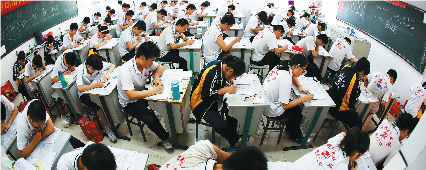
5月22日,河北省衡水市第二中学的高三学生在教室内复习。

距高考还有半个月,民间机构“上大学网”再次公布了第五批“中国虚假大学警示榜”,73所虚假大学被曝光。自2013年以来,该机构已累计公布5批共400多所虚假大学。 “新华视点”记者调查发现,前四批公布的300多所虚假大学中,只有4所网址还能打开,说明多数虚假大学已被打掉。一年间,缘何又冒出这么多虚假大学?