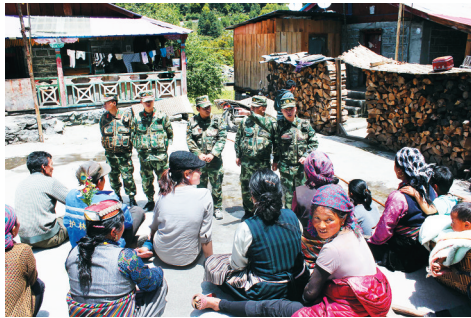
5月22日,西藏定结县发生地震后,当地群众在空旷场所临时避难。

10时05分,在西藏日喀则市定日县(北纬28.41度,东经87.59度)发生5.3级地震,震源深度约6公里。