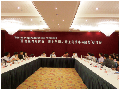
5月20日，“景德镇与海南岛——海上丝绸之路上的往事与随想”研讨会在海口举行。