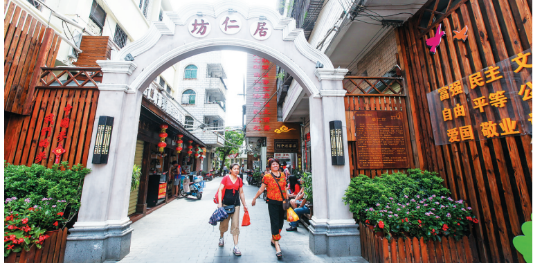
作为海口“双创”首条改造的小街巷，居仁坊面貌大改观。

子”，当作“天大的小事”，去年投入4亿元完成了858条小街小巷改造，今年还将投入6.92亿元，改造小街小巷1576条。