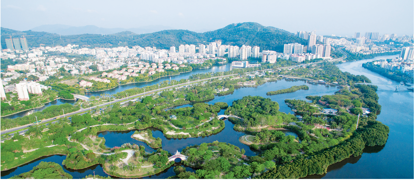
低空俯瞰三亚白鹭公园水清树绿。

2015年6月，国家住建部把三亚定为全国唯一的“双修”“双城”试点城市。“双修”，指的是生态修复、城市修补，“双城”，指的是建设海绵城市、地下综合管廊城市。三亚为此请来中国城市规划设计研究院等顶级设计机构主导规划编制，计划用10