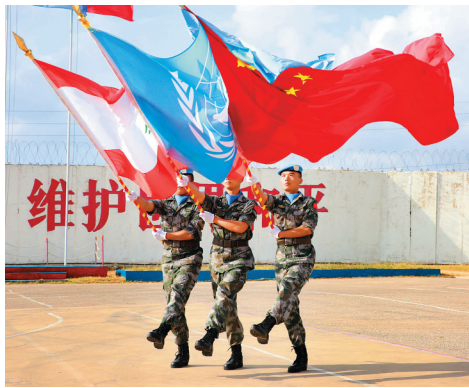
中国赴黎巴嫩维和部队完成轮换交接

平解决领土和海洋争议问题,认为主权国家自主选择争端解决方式的权利应得到充分尊重。在此背景下,我们坚决反对域外国家介入南海问题,反对南海问题国际化。