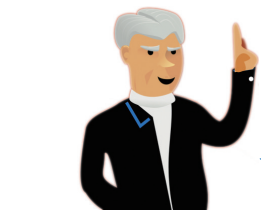
兹瓦特对南海争端所持的立场