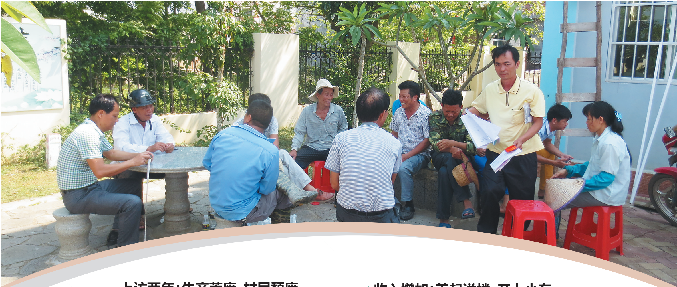
昔日,岭村村民聚集上访的景象不再。如今,村干部面对面向群众征求意见。