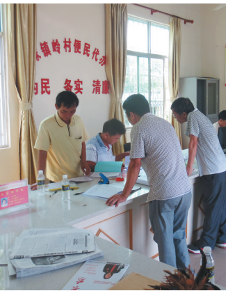
村民在便民代办点办理事务。

如今,面对土地纠纷,村民们不再上访,转而向法院提起诉讼,相信法律的判决。村干部也正在通过各种方式,弥合村民们因矛盾产生的感情裂痕,发展生产,提高村民收入。曾经的“上访村”正在变成一个“上进村”。