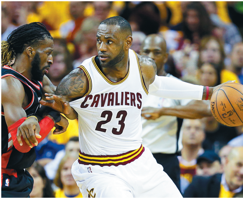
NBA东部决赛第五场 骑士大胜猛龙

实力对比的转变，勇士要逆转“1:3”难上加难。但我们也不必急着给勇士判“死刑”，他们是卫冕冠军，是一支创造了奇迹的伟大球队。对于勇士来说，所要做的是忘掉比分，打好每一场比赛。势头的转变往往悄无声息，但总是发生在永不放弃的坚持不懈中。