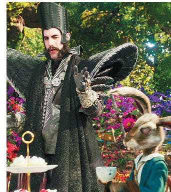
《爱丽丝梦游仙境2》剧照

《小蚂蚁之环球大冒险》也是一部国产动画片，讲述宇宙中有一颗叫布兰星的星球上居住着金木水火