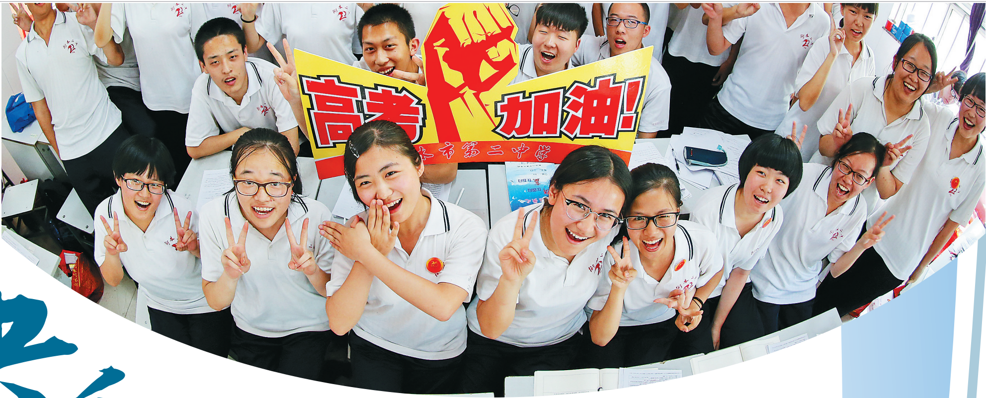
◀ 5月24日,河北省衡水市第二中学高三学生在教室摆出胜利手势。 2016年高考临近,不少中学通过开展多种形式的集体“减压”活动,缓解高三考生应考压力,帮助他们以自信乐观的心态迎接高考。