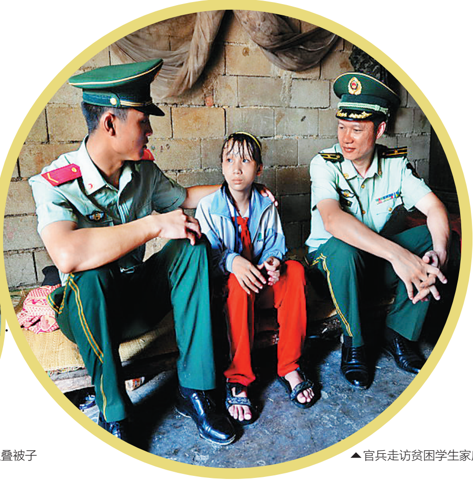
▲官兵走访贫困学生家庭