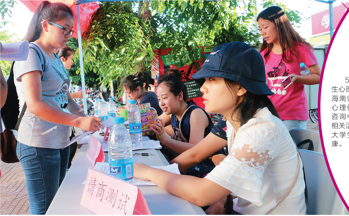
5.25 大学生心理健康日，海南师范大学心理健康教育咨询中心举办相关活动，关注大学生心理健康。

6.如果填错信息的话，能否重新上网纠正？ 在6月5日之前，你可以按照规定流程，多次上网纠正自己所填报的信息。需要注意的是，学生在入学时登记的家庭住址将会被录入全国学籍系统，学生入学后不得随意更改。