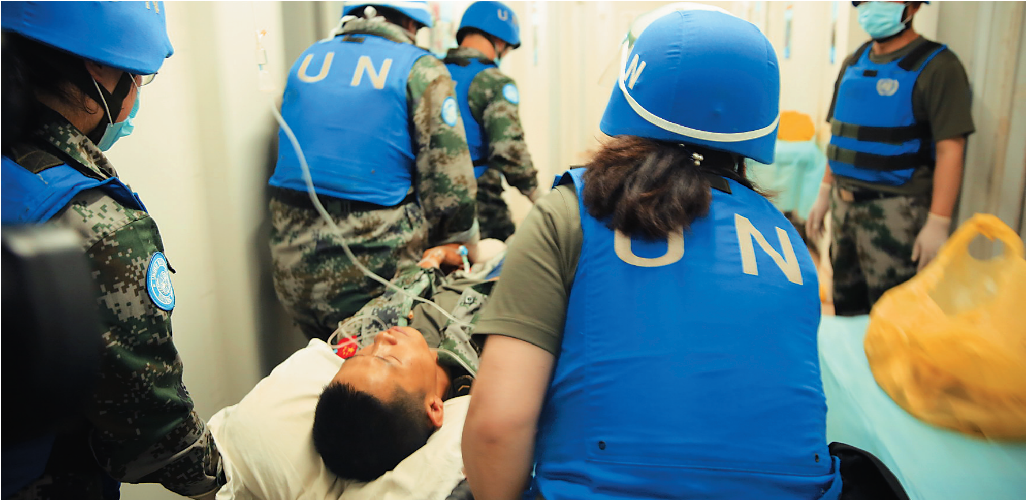
5月31日,在马里北部加奥,中国第四批赴马里维和医疗队救治袭击事件伤者。

■中国政府予以强烈谴责,要求立即展开调查,将凶手绳之以法 ■联合国安理会及联合国秘书长均发表声明强烈谴责