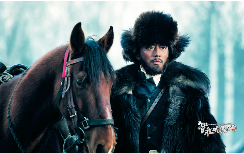
电影《智取威虎山》剧照

90后接受主旋律电影是摆在电影人面前的重大课题。黄建新认为,语境模式对于一部电影至关重要,“语境模式决定了电影的现代性,过去的电影总把感谢谁挂在嘴上,这种固定的语境模式,年轻人已经不接受了”。