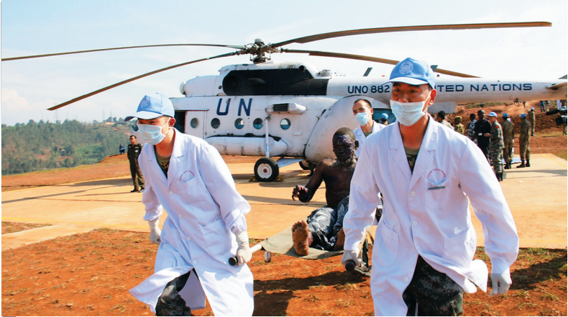
维和医疗分队医护人员搬运油罐车爆炸中的受伤者 二〇一〇年七月三日，中国赴刚果（金）维和医疗分队医护人员搬运油罐车爆炸中的受伤者

每年5月底，联合国纽约总部都会在一片肃穆中迎来维和人员纪念日，向献身维和事业的人员致敬，坚定维护世界和平的决心与梦想。