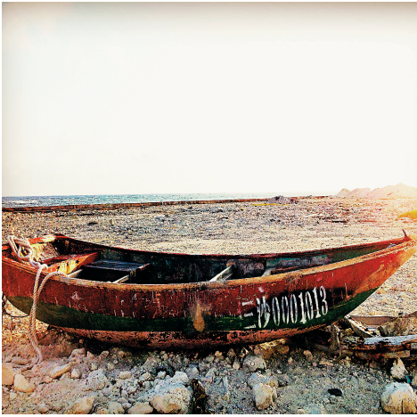
遥远的旧时光。

本报永兴岛6月6日电 (记者刘操)由海南日报社和三沙市委宣传部联合举办的“发现三沙之美”手机随手拍活动继续火热进行中,本期选登的作品为《遥远的旧时光》,作者为彭玉姣,作品拍摄地点为三沙永兴岛。