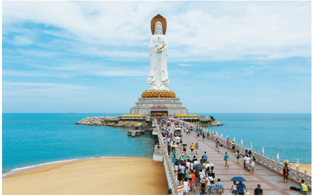
游客在三亚南山景区游览夏日美景。