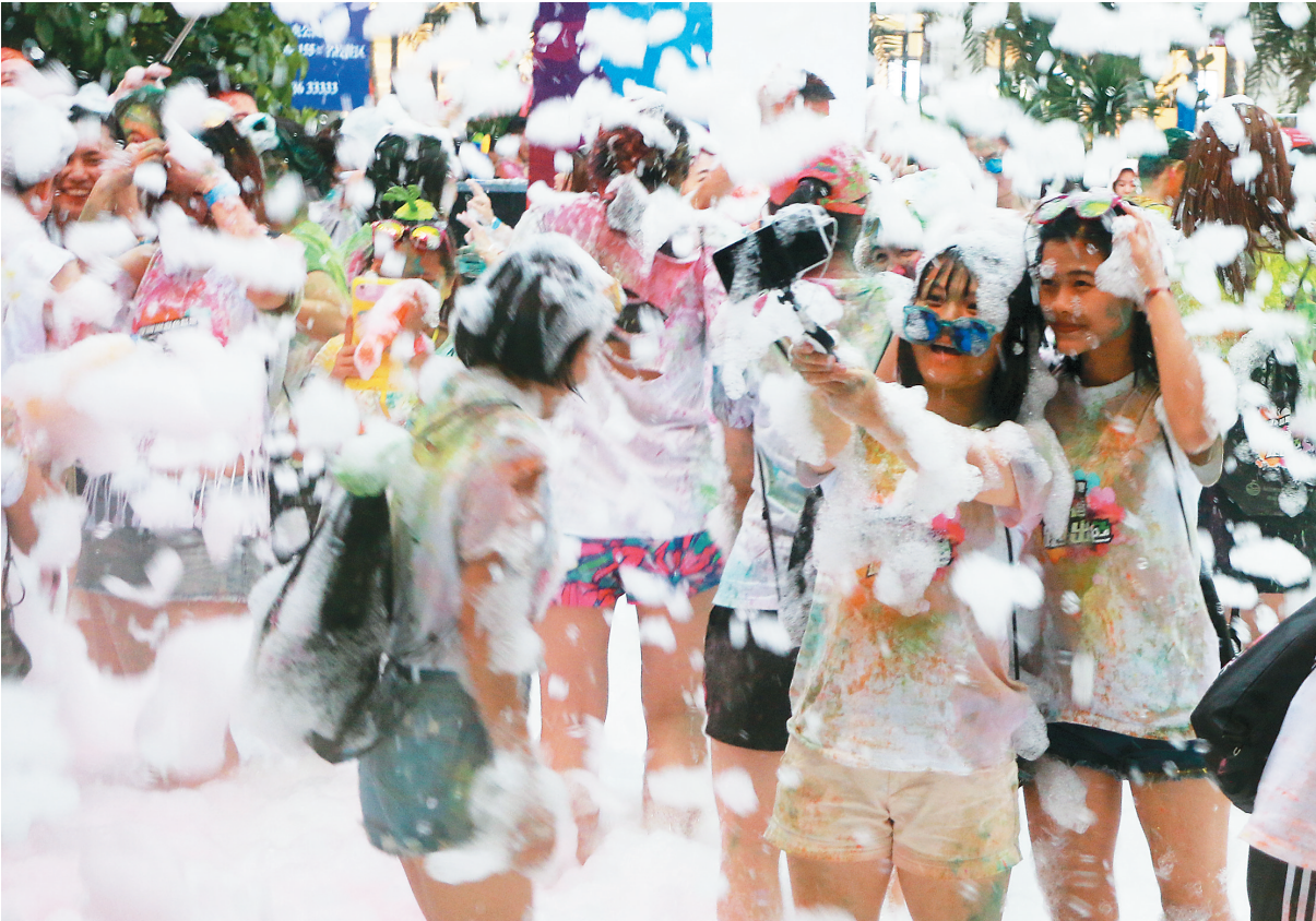
游客在海口观澜湖旅游度假区彩色酷跑活动泡泡大作战关卡玩得嗨翻了。