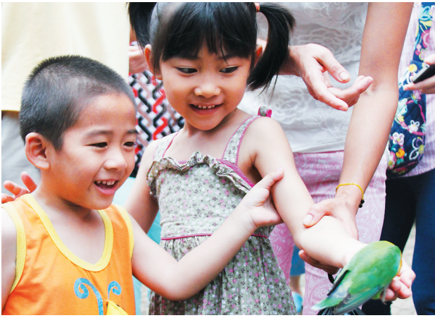
小游客在海南热带飞禽世界游玩。