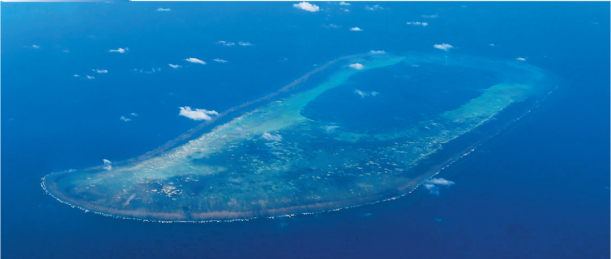
西沙北礁被琼海潭门渔民称为“干豆”。