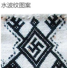
带“𪛗”形符号的寿龟图案