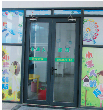
学校像一个快乐的儿童小镇。

当我在模拟邮局旁驻足观看时，不远处有 2 名学生快步朝这边走来，径直来到邮筒前，取出里面的信件，然后大致分工了一下，就抱着各自的信件跑开了。这里的信件有给学生的，也有给老师、校长的，从他们念叨的话语中，从他们给信件分类的过程中，从他们轻车熟路的动作中、快速奔走的步伐