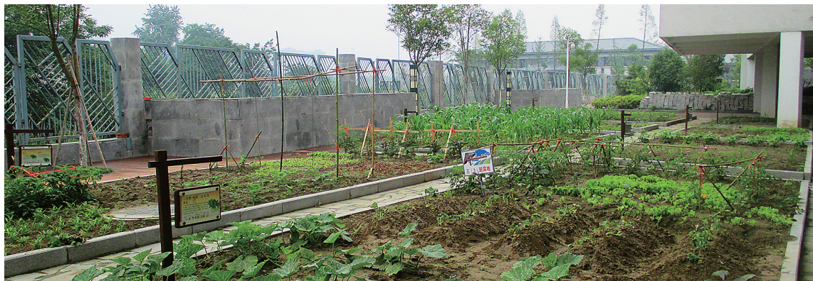
扬州市育才小学的班级实验基地——菜地。